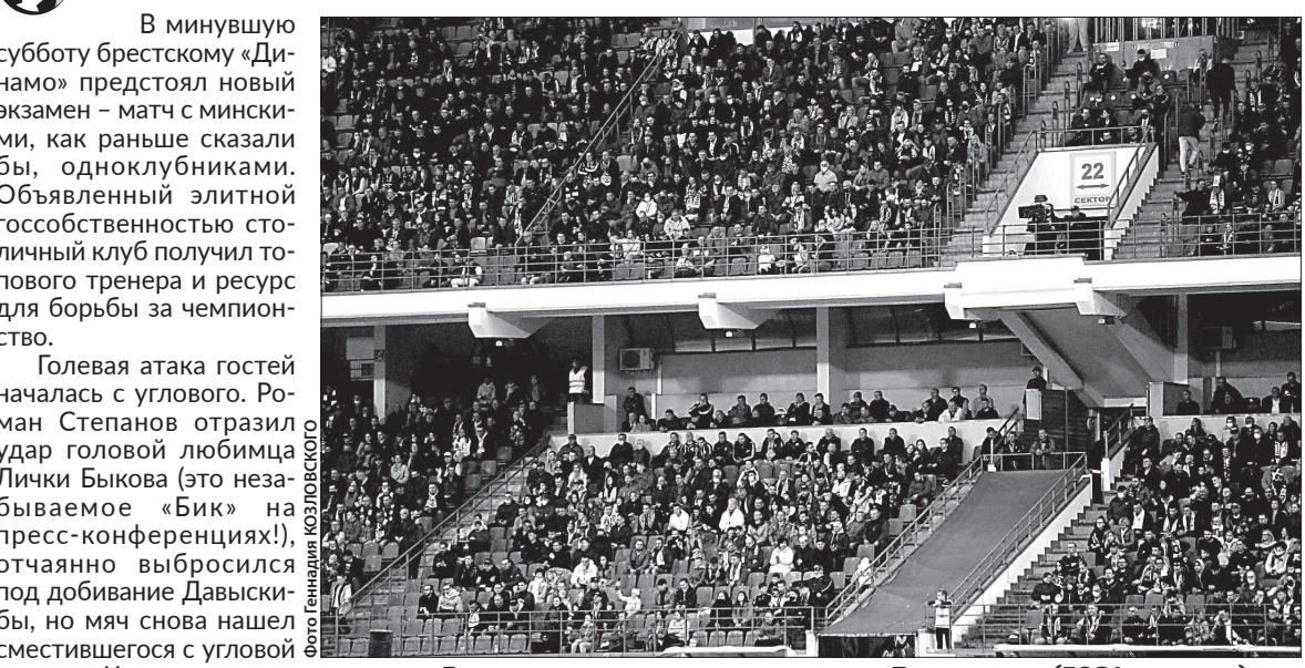
Рекорд посещаемости сезона на «Брестском» (5084 зрителя).